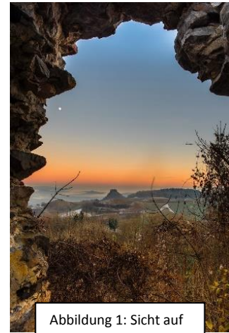
Abbildung 1: Sicht auf Vulkan Hohenkrähen

Dieses Jahr steht uns ein spektakulärer Frühlingsbummel bevor, welcher uns über Stock und Stein sowie Burgen und Vulkane führen wird!