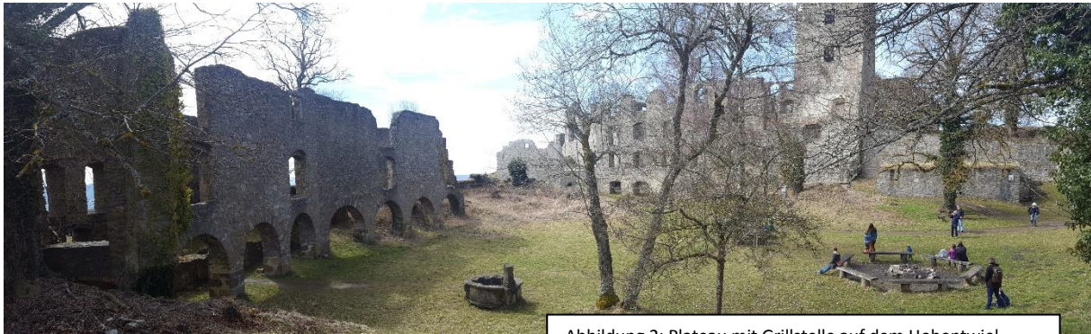
Abbildung 2: Plateau mit Grillstelle auf dem Hohentwiel