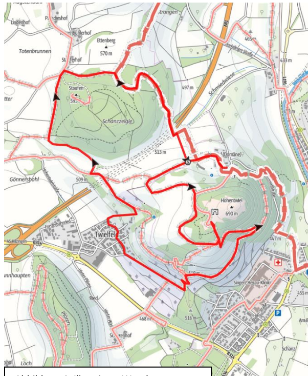
Abbildung 4: Illustrierte Wanderroute